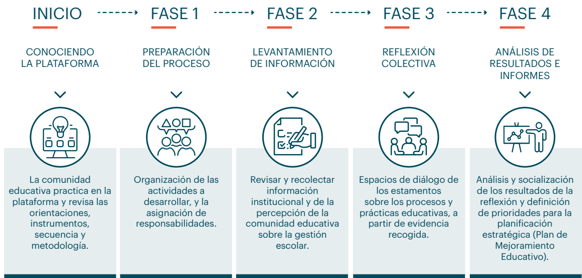
Tabla 2.1 Fases del proceso DID Escolar